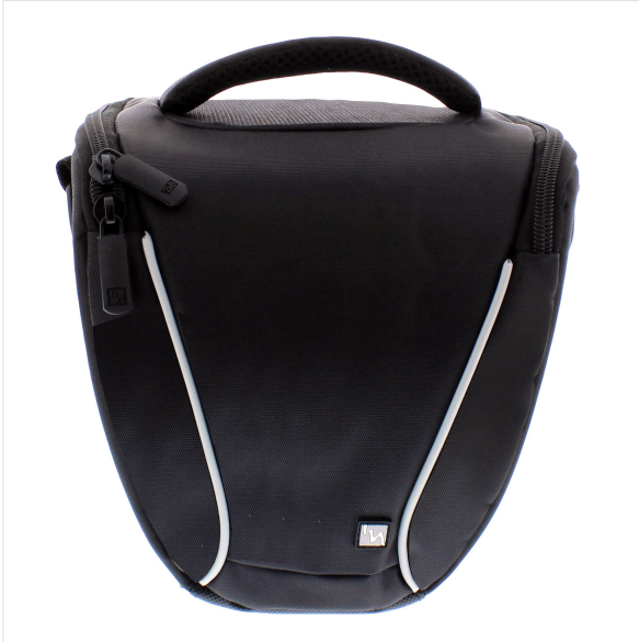
Imagen - Accesorios de cámara -

Bolsa para cámara réflex con espuma de alta protección para proteger tu cámara. Bolsillo de malla con interior para sus accesorios (tarjetas de memoria, cables, batería...)