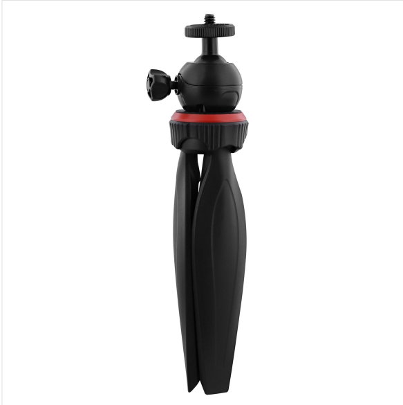
Imagem - influência -