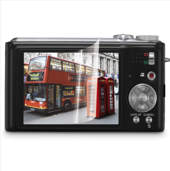
Imagen - Accesorios de cámara -

Protector de pantalla de alta calidad para cámaras y videocámaras 3 protectores de pantalla de 1.5" a 4" 1 paño de microfibra 1 tarjeta de crédito suave